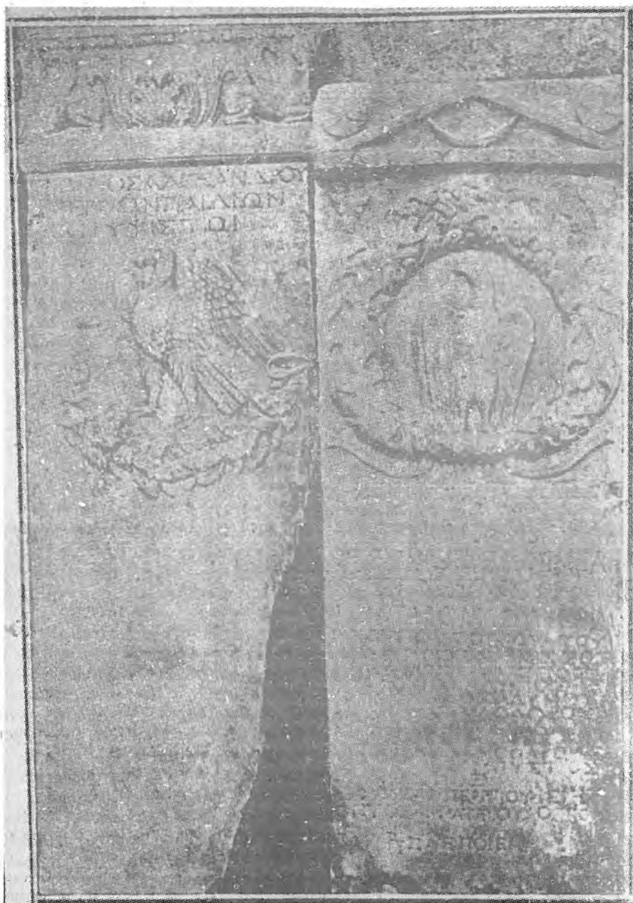
4. Посвещенията на Ζωίλος' Αλεξάνδρου от Едеса (към 7)