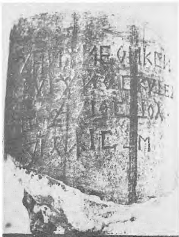
3. Посветителен надпис от Еуристос (№ 21)

на интерпретацията, но и на датирането, има все пак сигурно датирани към елинистическата епоха посвещения. Те очертават ареала на най-ранното разпространение на култа, който е ограничен на север от Ейдомене; на югозапад границата е Едеса, където паметниците от II в. пр. н. е. — II в. очертават едно от огнищата на постоянно поддържане на религиозната традиция. Другият подобен център е при Кожани, определен от паметници от елинистическата и римската епоха. Най-късно се датира паметникът от Пидна (250 г.).